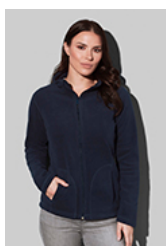
ST5100 Fleece Jacket